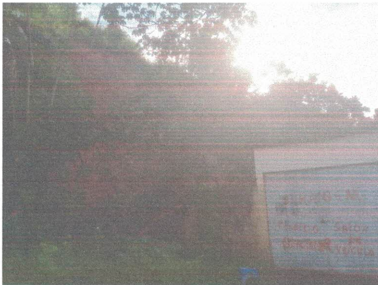
Sala das Sessões da Câmara Municipal da Cidade do Jaboatão dos Guararapes, em junho de 2022.

A árvore acima citada, corre o risco de desabar em cima da casa de um morador situada na área de risco. Devido às fortes chuvas dos últimos dias, ocorreu deslizamento na barreira que está localizada na lateral dessa residência onde fica a árvore que se trata da espécie Jaqueira. É de grande importância à realização desse serviço, pois a área foi visitada e foi constatada a necessidade da solicitação acima. Por isso se faz necessário a erradicação dessa árvore que está em alto risco de cair na residência, podendo causar uma grave tragédia. Me coloco a disposição para esclarecer quaisquer dúvidas em relação a solicitação.